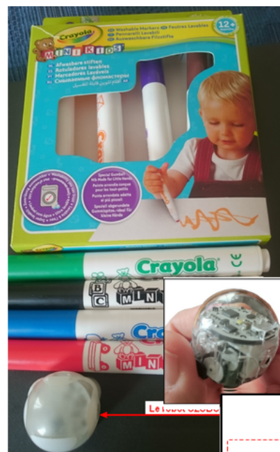
le robot OZOBOT Bit