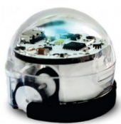
Le robot OZOBOT Bit (c)